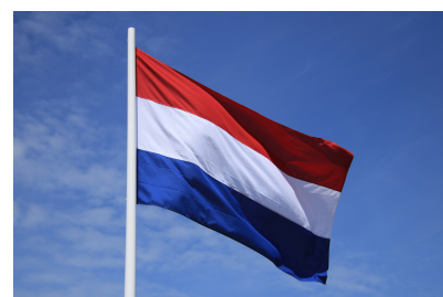
de Nederlandse vlag