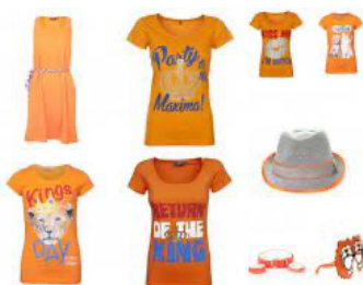
de oranje kleding