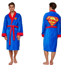
Superman badjas € 42,95