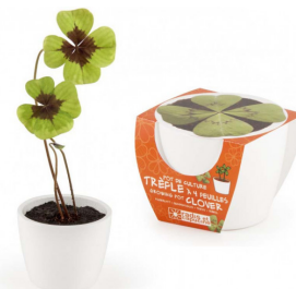
klavertje vier € 12,95