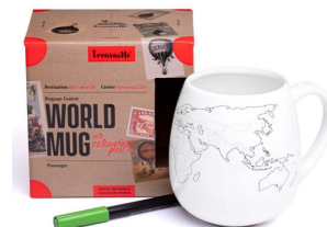
mok met wereldkaart € 21,95