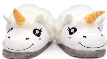
eenhoorn sloffen € 18,95