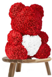
rozenbeer met hart € 49,95