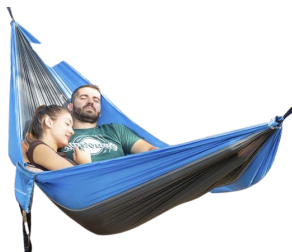
hangmat voor 2 personen € 32,95