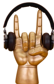
houder voor koptelefoon € 21,95