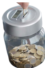
elektronische spaarpot € 14,95