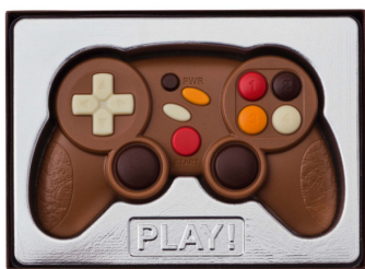
chocolade game-controller € 11,95