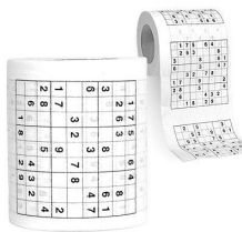
sudoku toiletpapier € 8,95