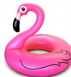
flamingo zwemband € 14,95