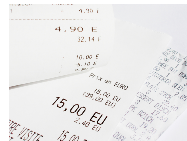
het ticket de kassabon