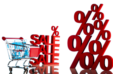
de solden de uitverkoop