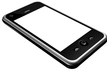
de GSM/de mobiel